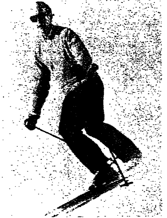
الرئيس الفرنسي جيسكار ديستان